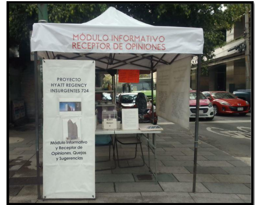
Instalación del Módulo Informativo, 20 de junio de 2022.

Lunes a Viernes de 9:00 a 17:00 horas Sábado de 10:00 a 13:00 horas